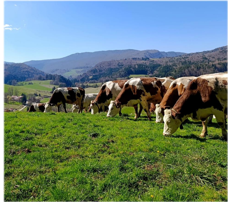
Début du déprimage la semaine dernière à 700 m d'altitude à St-Martin en Vercors (26)

Bien que la quantité d'herbe soit encore faible, l'effet sur la production des animaux est remarquable.